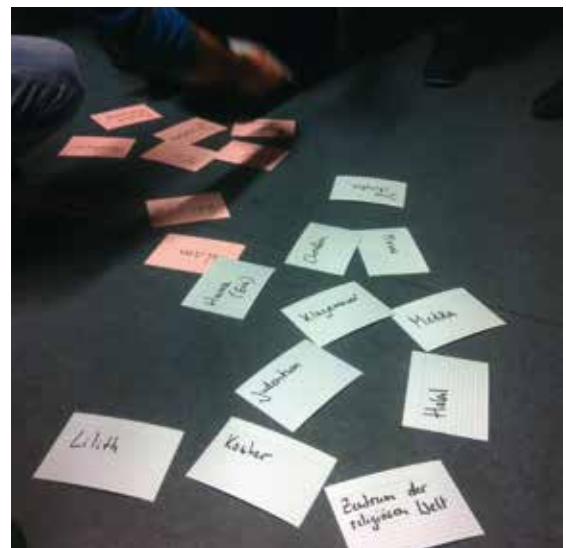
Workshop zum Thema »Nahost-Konflikt«

Aus der Perspektive einer Jugendeinrichtung bedeutet der Einsatz von Peer Educator einen Perspektivwechsel. So werden Jugendliche und junge Erwachsene nunmehr nicht nur als Zielgruppe gesehen, sondern und vor allem als Expert_innen. Besonders in Jugendeinrichtungen, welche von Gruppen besucht werden, die hinsichtlich des Alters und des Bildungsstands sehr unterschiedlich sind, ist der Einsatz von Peer Educator ein bewährtes Konzept. Denn jede_r bringt andere Stärken und Fähigkeiten mit und bekommt so die Möglichkeit, ihr_sein Wissen zu teilen. Jugendliche und junge Erwachsene mit ihren unterschiedlichen (Migrations)Geschichten können Erfahrungen und Perspektiven auf ihre Lebenssituation in Deutschland weitergeben und zugleich erweitern. Damit eröffnet sich in der Jugendeinrichtung ein erweiterter Bildungsraum, der viel zu oft nicht genutzt wird. Ein Bildungsraum, der die Ressource »Wissen, Erfahrungen und Kompetenzen von Jugendlichen für Jugendliche« als zusätzliche Chance der Politischen Bildung erkennt.